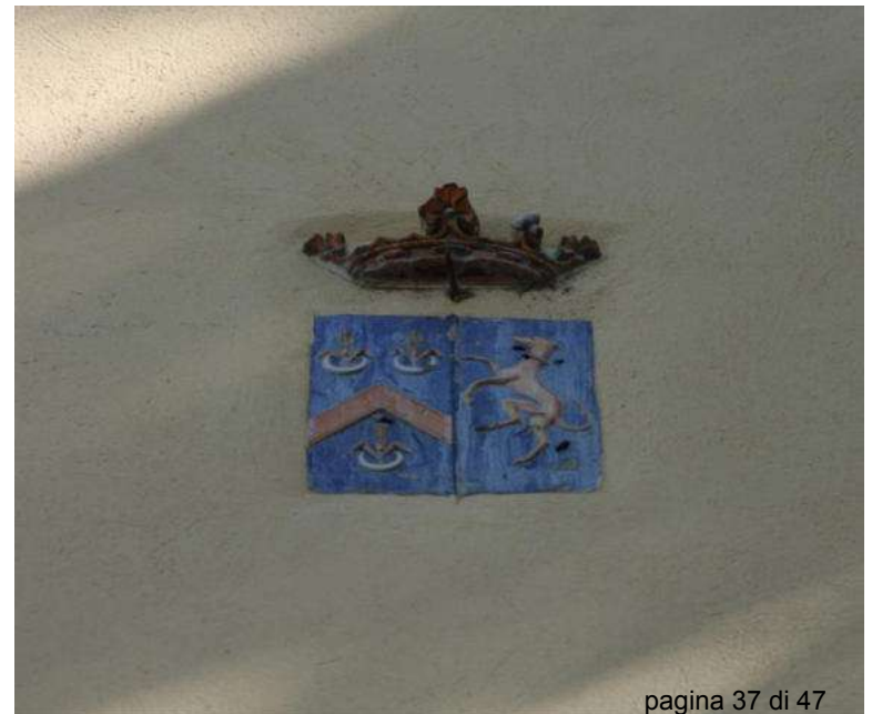
7. Lo stemma dei Sampieri Talon sulla facciata dell'Oratorio