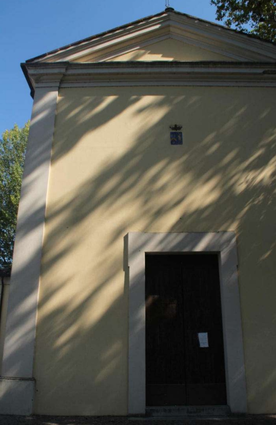
6. L'Oratorio di San Donino